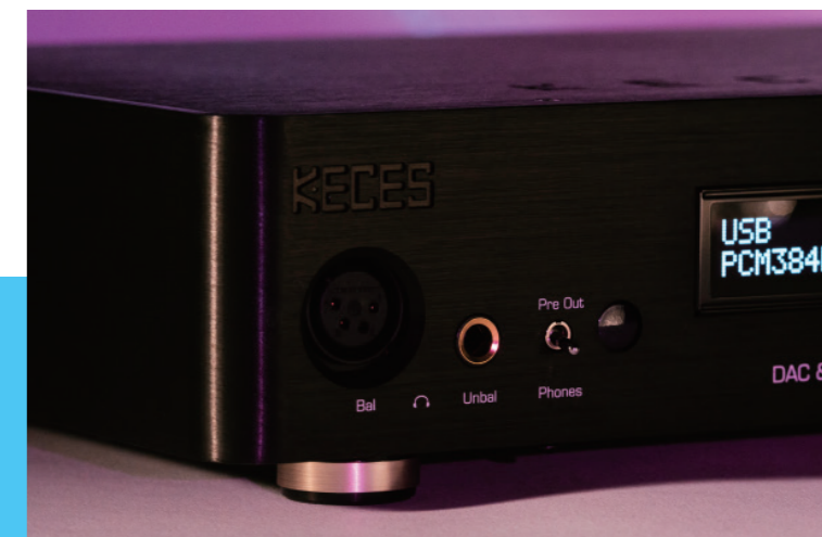
S3除了是前級擴大機，也是耳機擴大機，可藉由搖頭開關切換前級或喇叭輸出。