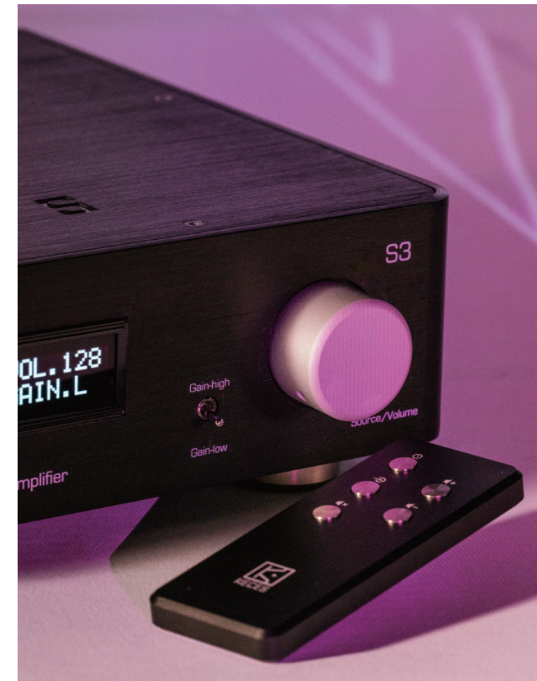
面板提供簡單的音量及取樣率顯示，旋轉音量旋鈕時會聽到機內繼電器跳動的聲音。